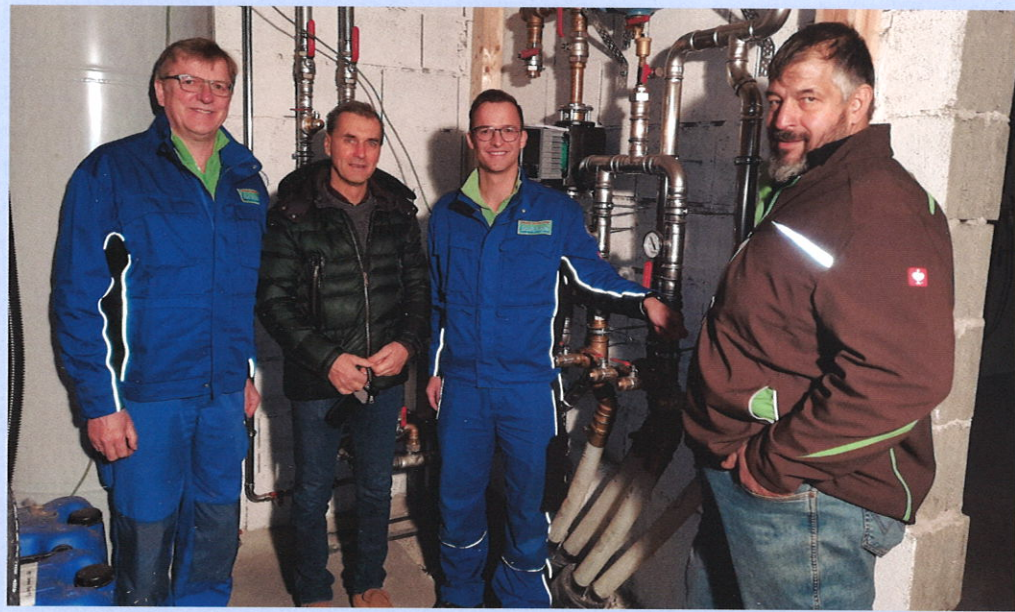
▲ Die Firma Öko Energiehandel Wörz betreibt das Blockheizkraftwerk für das Fernwärmenetz in Hohenreuten

Bereits Ende 2019 wurde im Zuge der anstehenden Erneuerung der Abwasserkanäle in Hohenreuten überlegt, ob es nicht sinnvoll wäre ein Fernwärmenetz in Hohenreuten zu errichten. Es bot sich an, da sämtliche Hausanschlüsse für das neue Abwassernetz und für das neue Glasfasernetz aufgebaggert werden mussten und das Blockheizkraftwerk von der Firma Öko Energiehandel Wörz bereits überschüssige Wärme zur Verfügung hat. Im Frühjahr 2020 fanden die ersten Vorabgespräche und ein Informationsabend durch die Gemeinde für einen möglichen Energieabsatz in Hohenreuten statt. Nach sämtlichen behördlichen Anträgen, Baubewilligungen und Ausschreibung der Arbeiten, wurde das Projekt „Abwasser-, Fernwärme- und Glasfaserleitung“ in Hohenreuten aktiviert.