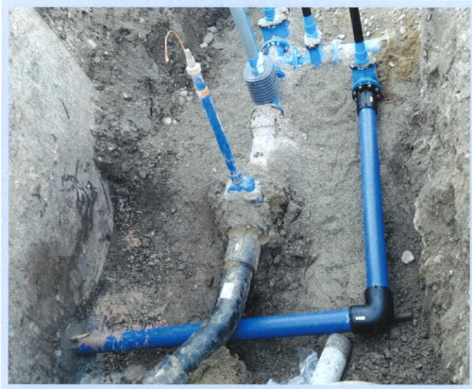
▲ In Unterrieden wurde der Brunnenweg mit einer neuen Wasserhauptleitung ausgestattet