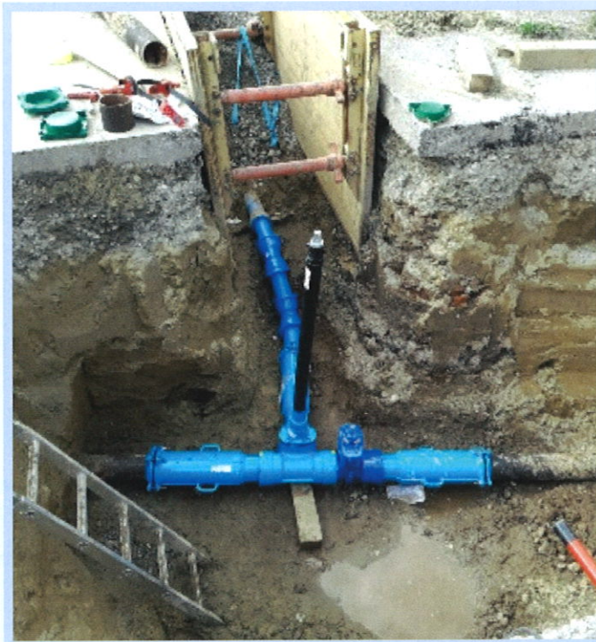
▲ In der Kirchstraße in Oberrieden wurde die Wasserleitung erneuert

Ende 2021 wurde von der Firma Lutzenberger in Oberrieden neue Kontroll- und Amateurschächte für die Wasserversorgung eingebaut. Die Inbetriebnahme wird Anfang 2022 sein.