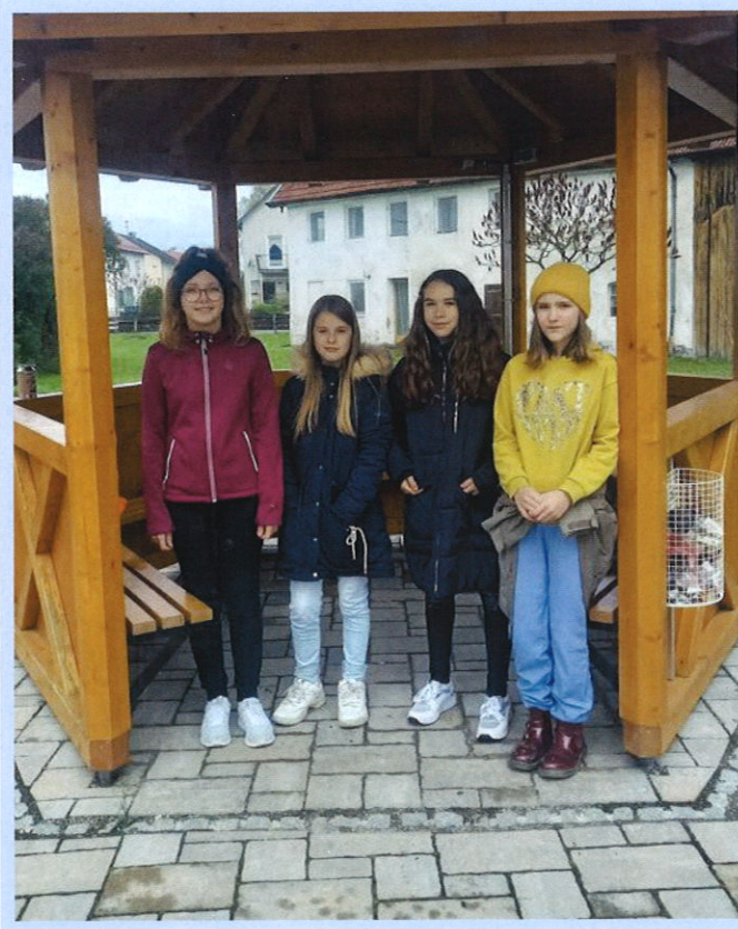
▲ Die Firmlinge aus Oberrieden hatten viel Spaß bei der Dorfrallye

Die Firmlinge 2021 aus Oberrieden konnten coronabedingt nicht auf bisherige Aktivitäten zurückgreifen und so war nach einem Beratungstreffen die Idee zu einer Rallye (Schnitzeljagd) durch Oberrieden geboren. Am 13.05.2021 – Christi Himmelfahrt/Vatertag - war es soweit und die Dorfrallye startete am Gemeindeplatz. Dort wurden die Laufpläne durch die Firmlinge an die Teilnehmer ausgegeben. Die Strecke führte quer durch Oberrieden. Dabei konnte man bei verschiedenen Fragen und Aufgaben so Allerhand erfahren, z.B. dass es in Oberrieden mal eine Tankstelle gab oder wer sich hinter einem bestimmten „Hausnamen“ verbirgt.