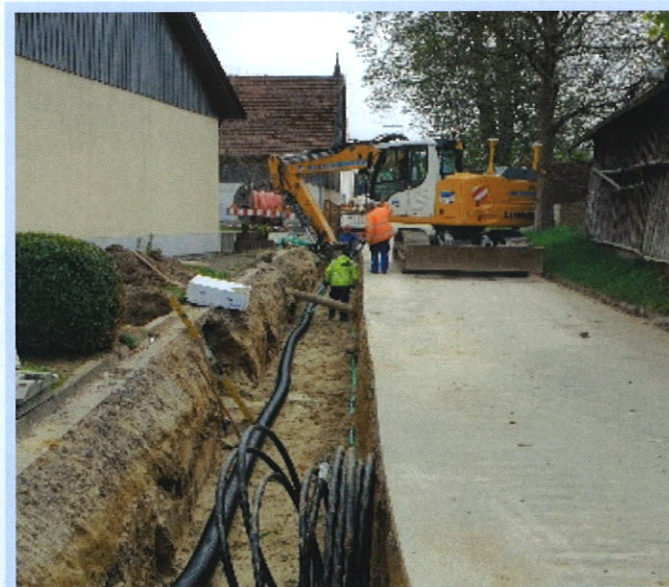
▲ In Hohenreuten wurde mit einer neuen Fernwärmeleitung ausgestattet

In Unterrieden wurde der Brunnenweg mit einer neuen Wasserhauptleitung ausgestattet.